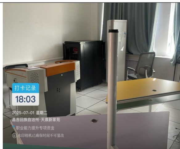
图 1 电商实训基地办公桌椅、空调