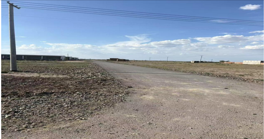
图 1：图 2：大泉湖村乡村道路